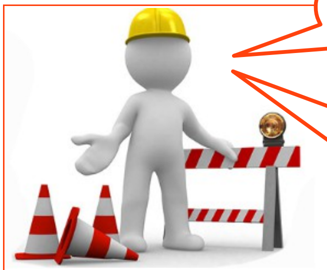
Figura 1 - http://www.ciesp.com.br/jacarei/sobre/historia/

Vai iniciar uma obra? De construção, reforma ou ampliação?