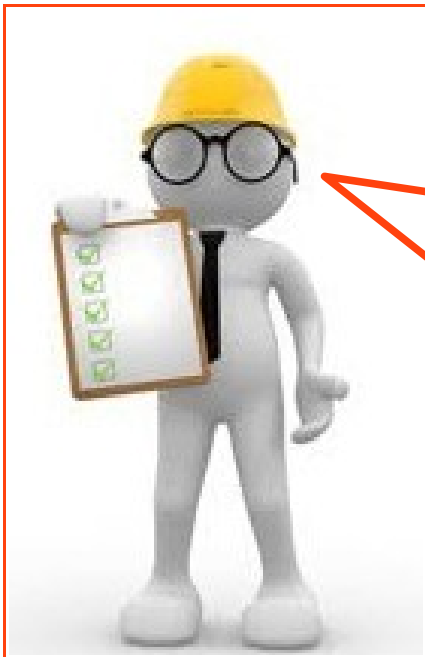
Figura 9

Além das obras de construção, ampliação e reforma, existem outras atividades que também precisam da autorização da Prefeitura antes de serem iniciadas, as atividades são as seguintes: obras de restauração, demolições, e movimentação de terra (cortes, escavações e aterros).