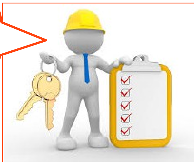
Figura 5 - http://estevesamorim.com.br/empreendimento-detahel.php

E não se esqueça! Ao finalizar sua obra é preciso retirar na Prefeitura seu Habite-se. Porque sem o habite-se você poderá ter dificuldades para financiar ou vender seu imóvel.