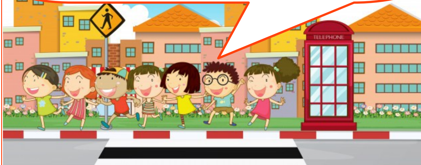
Figura 15

Todo proprietário de imóvel com ou sem construção, deve manter a calçada em frente ao seu imóvel em boas condições de uso, fazendo a sua manutenção sempre que for preciso. Para que ela esteja sempre em boas condições de uso, garantido assim, a livre circulação de todos e a segurança dos pedestres.