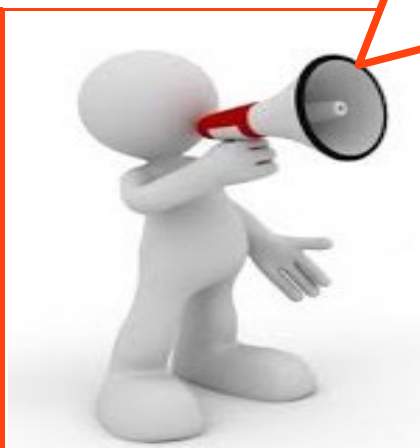
Figura 19