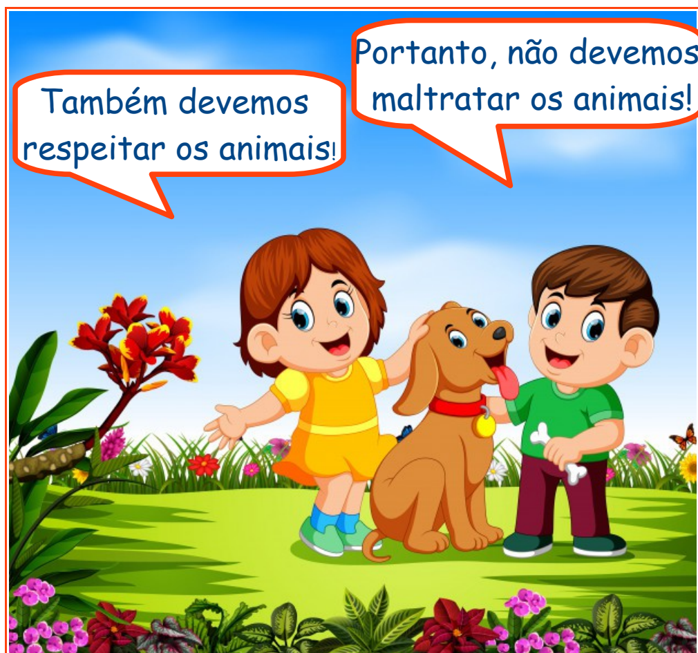
Figura 18

É proibido perturbar o sossego público ou particular com sons ou ruídos excessivos. Devemos respeitar o espaço do outro!