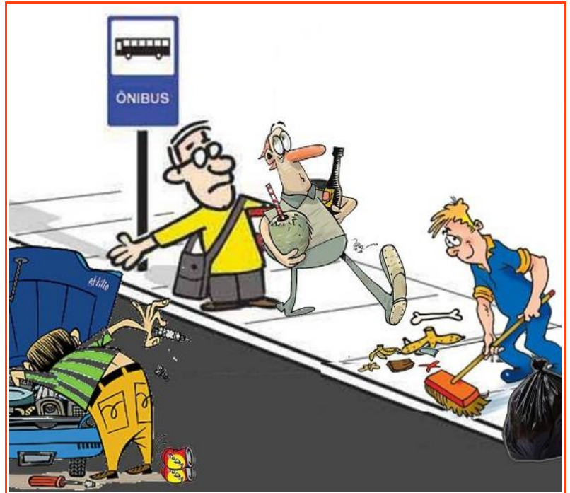
Figura 12 - https://cadeiranteemprimeirasviagens.wordpress.com/tag/calçadas/

Devemos contribuir também mantendo nossas calçadas limpas e roçadas, nada de matinhos, pessoal! Não colocar entulhos de construção nas calçadas, ou quaisquer materiais que possam impedir que os pedestres as utilizem, pois precisamos garantir também a segurança de todos.