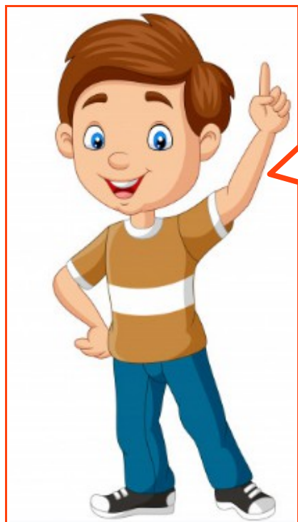
Figura 16

O lixo deve ser descartado nos lugares corretos, nada de descartar lixo, materiais velhos, cadáveres de animais, ou qualquer outro detrito em terrenos vazios, ou em quintais vizinhos. Vamos respeitar o que é do outro!