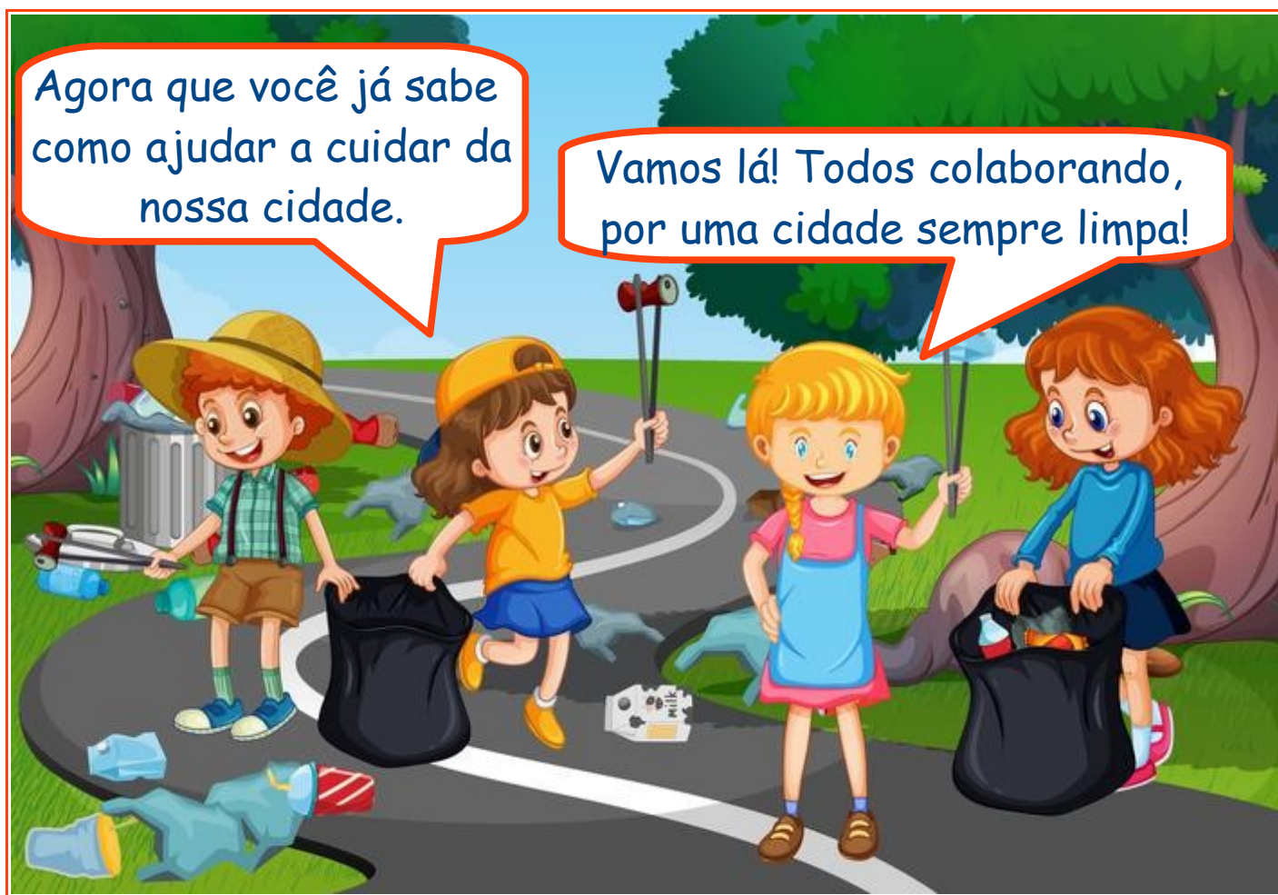
Figura 20 - https://pt.vecteezy.com/arte-vetorial/373864-criancas-voluntariado-limpando-parque